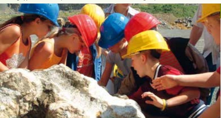
Kindergruppe im Steinbruch

18 Tourist-Info Bad Nenndorf, Haus Kassel, Hauptstr. 4, 31542 Bad Nenndorf € 4 € / Person, mit Gästeticket: 2,50 € / Person ☎ TI Bad Nenndorf, Tel. 05723 / 74 85 60, tourist-info@badnenndorf.de, www.badnenndorf.de