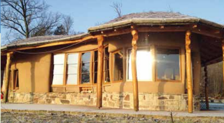
Bienenhaus der Schaumburger Waldimkerei

20 Bienenhaus der Schaumburger Waldimkerei, Zum Forsthaus 21, 31552 Apeln / Reinsdorf € Spende erbeten ☎ Schaumburger Waldimkerei e.V., Tel. 0163 / 68 08 792, info@das-bienenhaus.de, www.das-bienenhaus.de, www.wald-imkerei.de